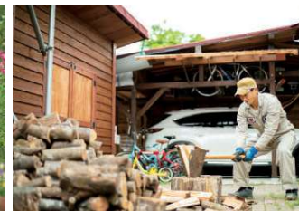
左 / 「植物によって成長速度が違うので一度に完成しないのが面白いんです」と光さん 右 / 森を元気に保つために間伐した木の一部は、薪として再利用。「安芸太田町は山の面積が大きいので維持・有効活用できるように尽力したい」と賢さん