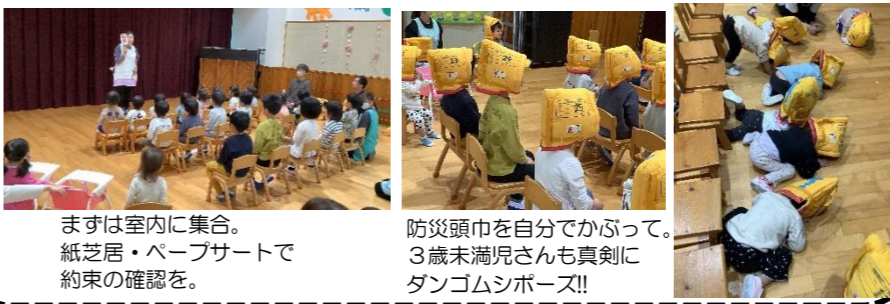
まずは室内に集合。紙芝居・ペープサートで約束の確認を。

避難訓練の日は、まず全員で集まり避難時の約束を確認。併せて防災頭巾の被り方の練習をしました。その後「今から避難訓練がありますよ！」と伝えてから、火災発生を想定した避難訓練を。(非常ベルを鳴らして。)みんな真剣な顔つきで避難しました。起きてはならないことですが、いざという時のためには日頃から訓練を積み重ねておく必要があります。年間を通じて、様々な火元を想定した火災、地震、風水害、不審者対応などの訓練をします。事前に知らせないなど、内容や発生時間、避難場所などの状況を変えて実施します。4月の訓練後、家で「ダンゴムシポーズ」をして見せた園児もいたようです。ご家庭でも防災について確認しておきましょう。