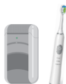
ひげそり・ 電動歯ブラシ