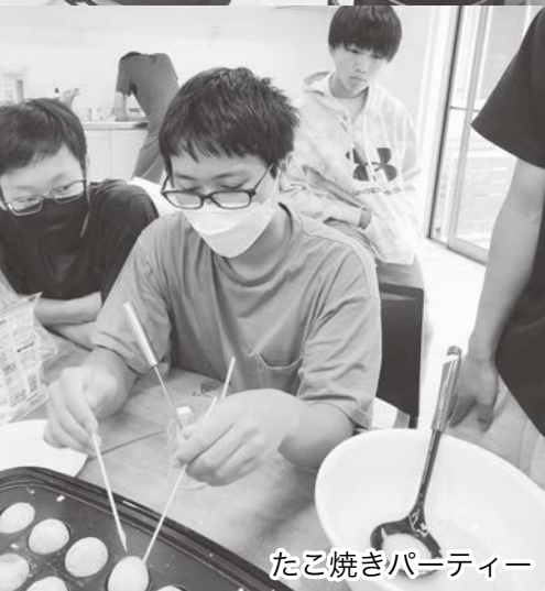
たこ焼きパーティー