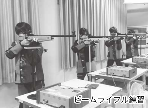
ビームライフル練習

加計高校での生活は3年間しかないもので、できれば「もっと長く加計高校ライフを楽しみたい」と思わせてもらえる素敵なところで、めっちゃオススメです！