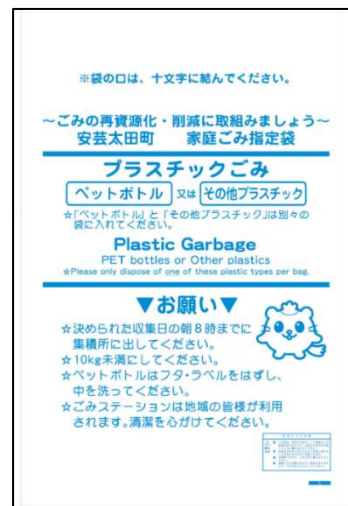
プラスチックごみ