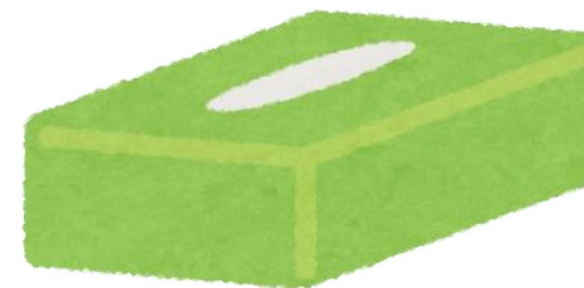
ティッシュ等の紙箱