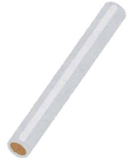
トイレットペーパー・ラップ芯