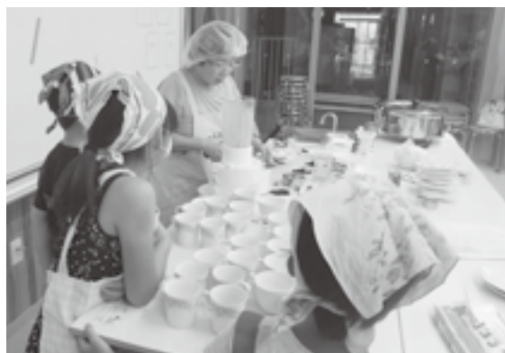
夏休み放課後教室の様子