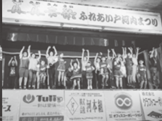
M★M★Music Dance Club