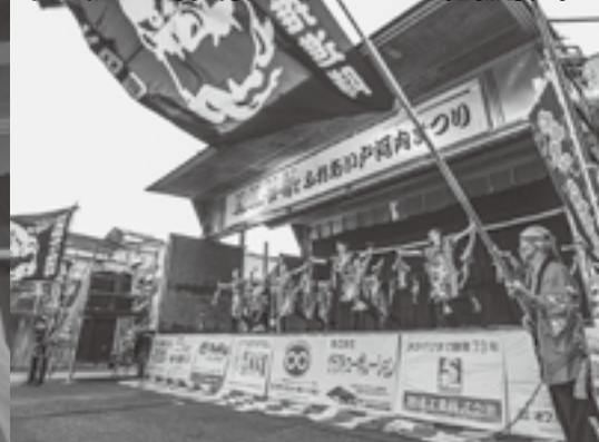
安芸太田町健康運動クラブ連絡協議会